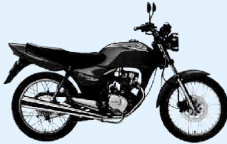
moto Honda CG 125

A campanha de sindicalização promovida pelo Sindicato chega na reta final. O último sorteio de prêmios acontece no dia 13 de dezembro, das 17h às 17h30min e será transmitido ao vivo pela Rádio Comunitária Alternativa FM 104,9. Se você não está sindicalizado(a), ainda é tempo, aproveite e participe do sorteio de uma Moto Honda CG 125, máquina de lavar roupas e TV colorida de 20 polegadas. A diretoria do Sindicato convida todos os associados(as) a comparecerem na sede ou acompanharem o sorteio pela Rádio Alternativa.