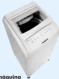
máquina de lavar roupa