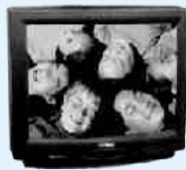
Duas TVs coloridas 20 e 29 polegadas